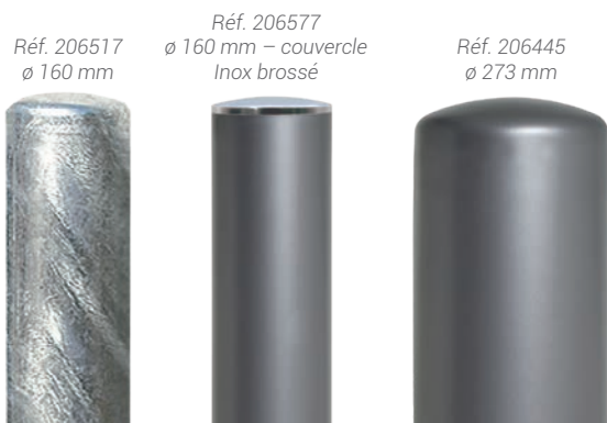
Réf. 206517 \varnothing 160 mm