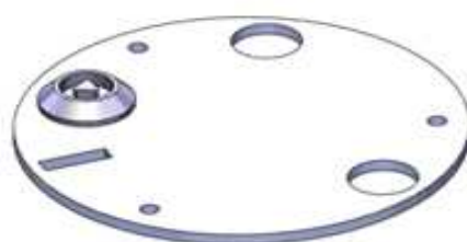
Figure 2 - Le couvercle