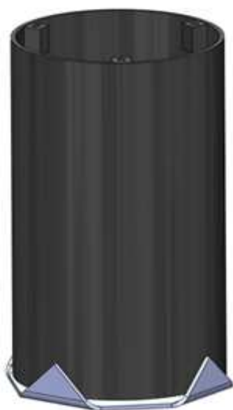
Figure 1 - Le socle