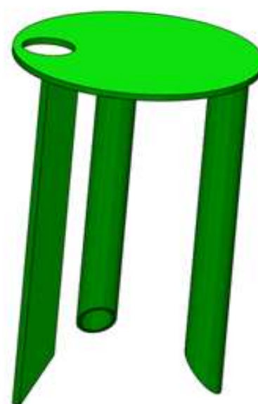
Figure 3 - La borne

L'ensemble livré comporte 3 éléments principaux. Le socle (à gauche), le couvercle (au centre) et la borne (à droite). Ici, n'est représentée de la borne que la platine inférieure car ce système est adaptable à plusieurs types de bornes. La borne livrée est solidaire de la platine verte.