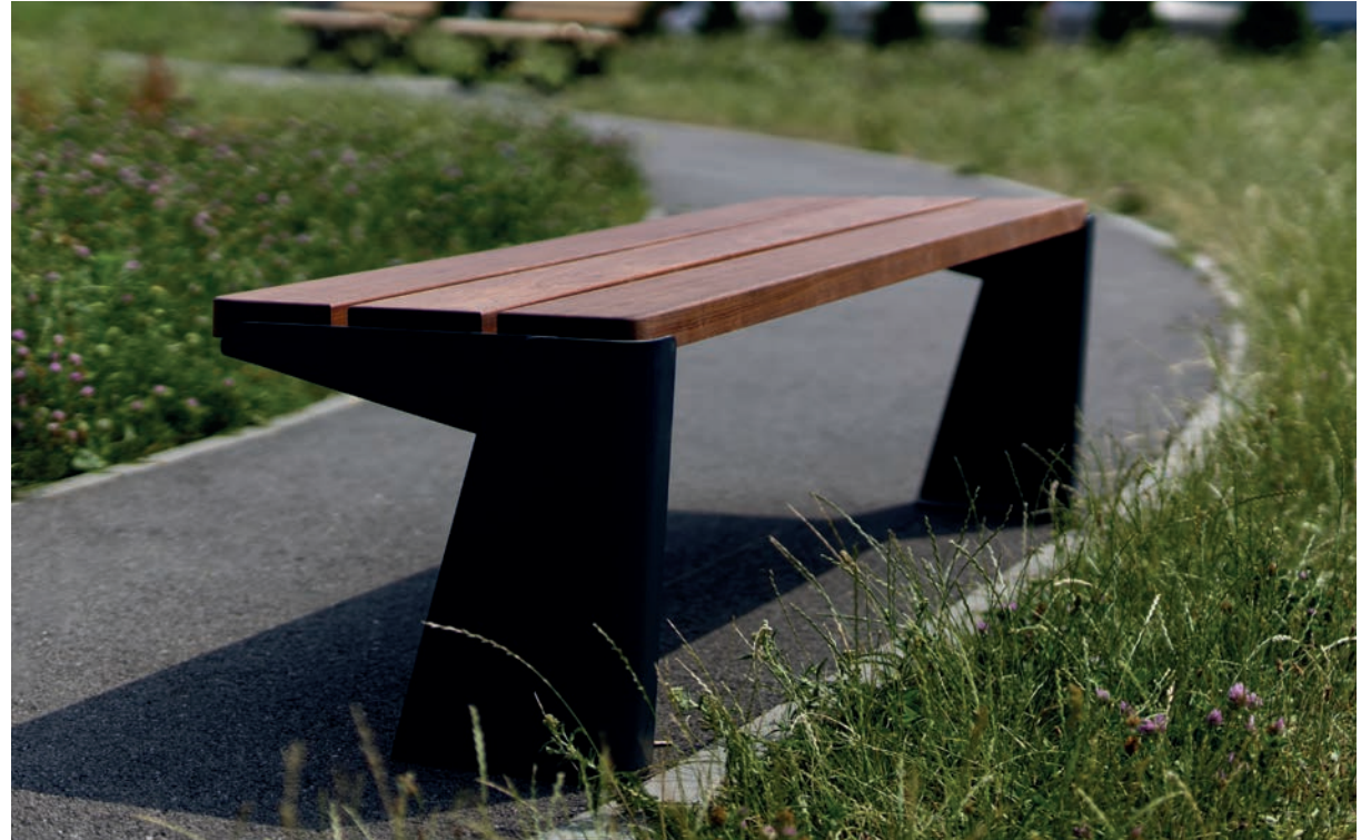
Cette image est illustrative et peut ne pas exactement reproduire le produit décrit.

Pour toute les peintures ne faisant pas parti de cette carte, merci de bien vouloir nous consulter.