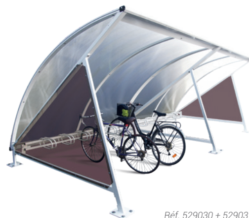
Réf. 529030 + 529031