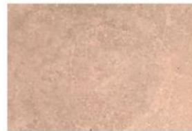
BETON LISSE BRIQUE ROUGE