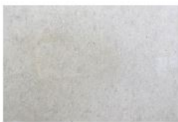
BETON LISSE BRUT