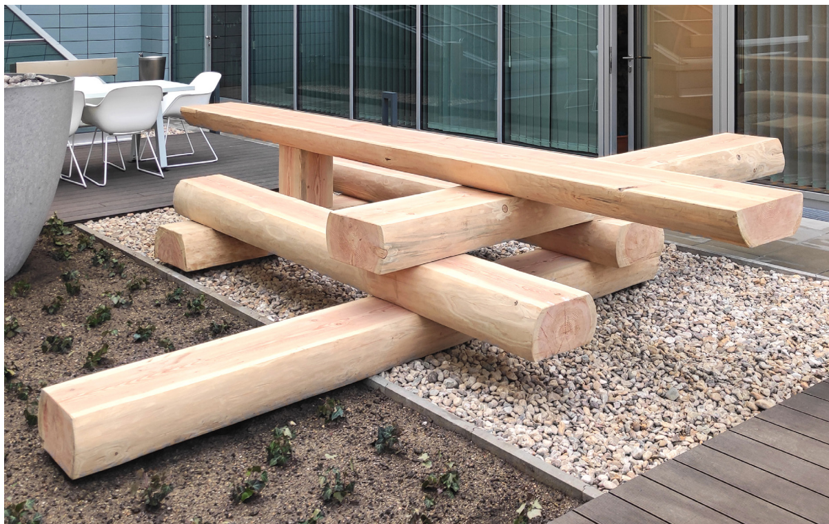
Cette image est illustrative et peut ne pas exactement reproduire le produit décrit.

Aucune peinture n'est appliquée sur ce produit.